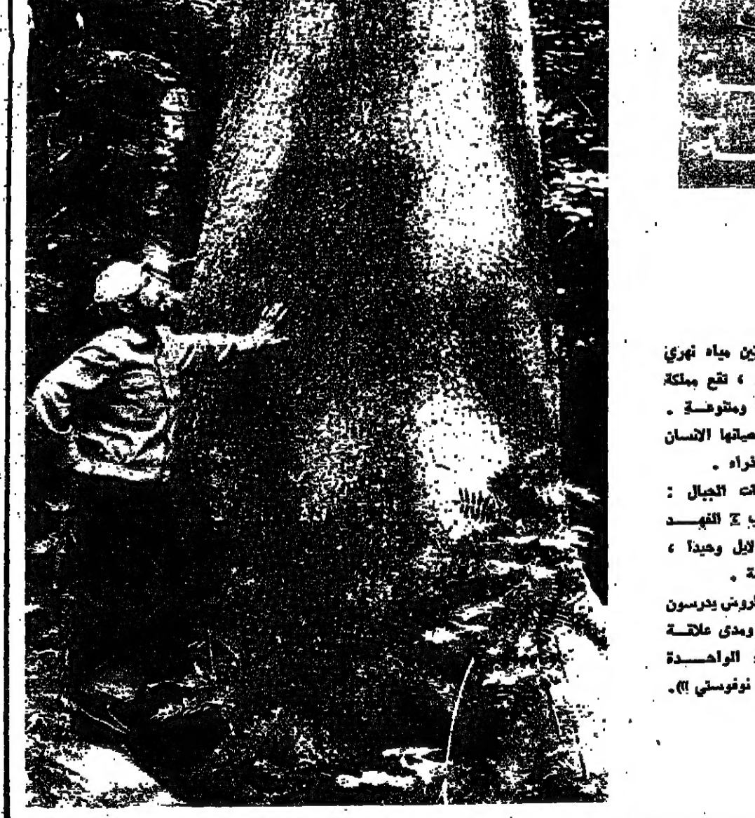
عائل الغابة الصغراء يفحص شجرة